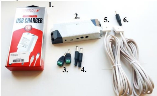
Рис. 1. Базовый комплект поставки устройства TUYA WIFI (может меняться в зависимости от заказа)

В зависимости от вашего выбора при заказе в магазине в комплект поставки могут входить различные компоненты, внешний вид которых приводится на рис. 1.