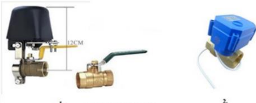
Рис.3. Типы запорной арматуры, совместимой с устройством СТОП-БЕДА

Устройство СТОП-БЕДА поддерживает следующие виды электрических кранов (см. рис. 3) Кран №1 это манипулятор (механическая рука) монтируемый на уже установленный у пользователя кран воды или газа. Кран №2 является шаровым электрическим краном с переходом на пластиковую трубу типа "американка".